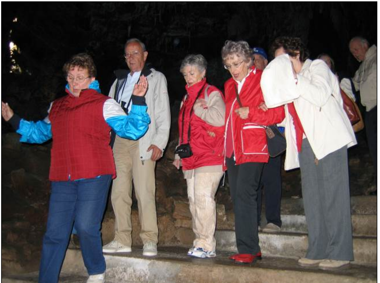
Visita interessante, molto interessante. Man a mano che procedeva me la ricordavo, 25 2006 - 6