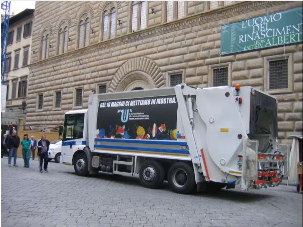
10 Maggio 2006