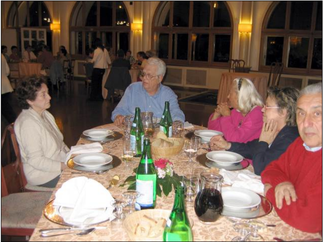
Cena, da 47 euro a persona tutto compreso. Ma senza infamia e senza lode.